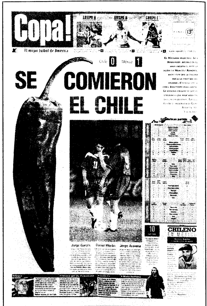
ILUSTRACIÓN Nº1: PORTADA DEL SUPLEMENTO 'COPA!' DE 'EL METROPOLITANO', 1/7/99. EL TÍTULO Y LA IMAGEN RESUMEN EL RESULTADO DEL PARTIDO EN FORMA ICONOGRÁFICA.

puede decidir todo un partido. El azar es azar justamente porque no se explica nomológicamente.